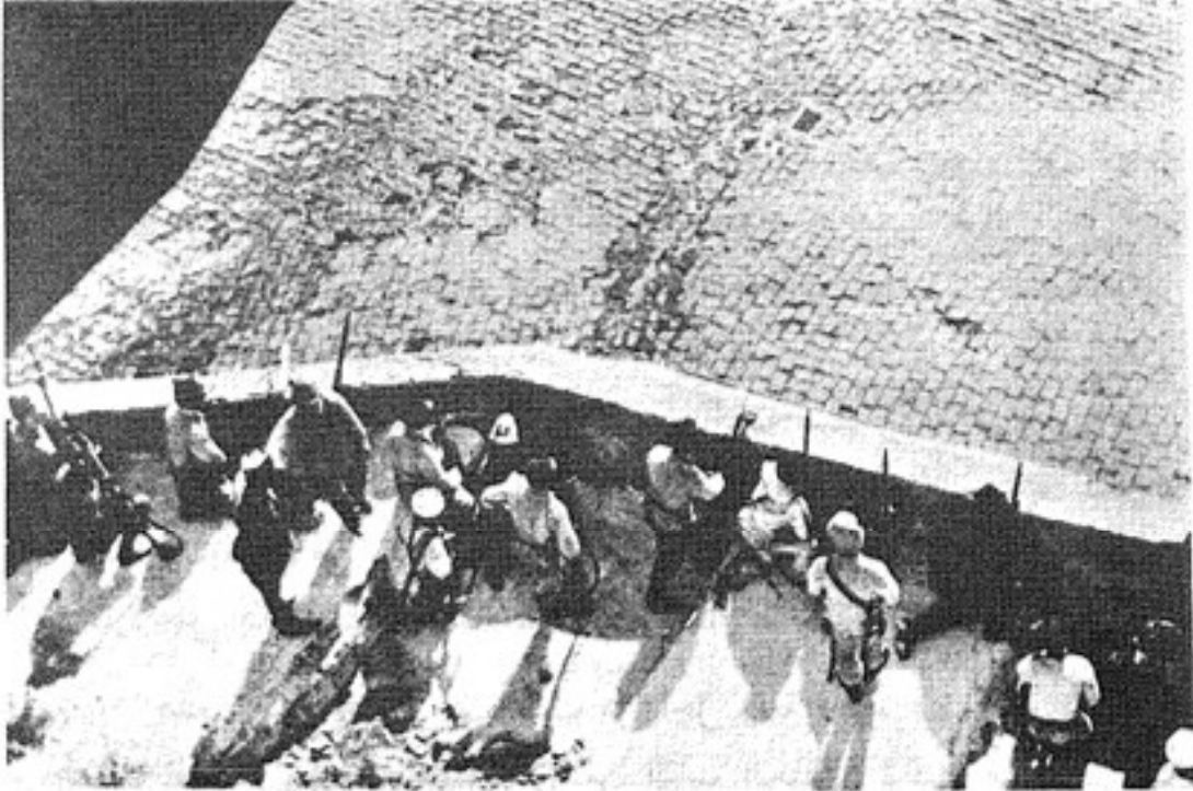
الجنرال كانيفا مع الجنود الايطاليين في الصحراء

موالين أصبحوا في الحقيقة معادين مما جعل الجنرال يظهر نوعاً من الجنون بالاهتمام المفرط بحماية نفسه لدرجة أن العرب الذين تعودوا على تقدير الشجاعة الفردية في قوادهم أكثر من أي شيء آخر صاروا يشعرون بالسخط والحقد، بينما لم يكن الجنود والضباط الايطاليون على هذه الدرجة من سمو التفكير.